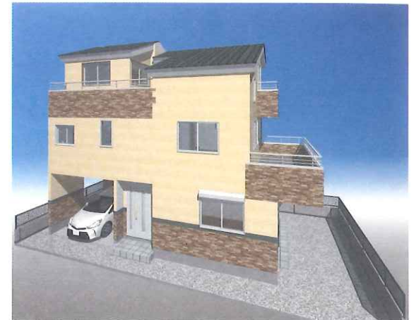
※完成予想パースにつき実際と異なる場合があります。